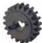
Зубчатое колесо Z20 зубчатая рейка