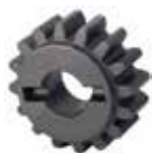
Зубчатое колесо Z16 зубчатая рейка