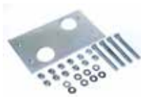
Монтажная пластина регулируемая по высоте и горизонтали.